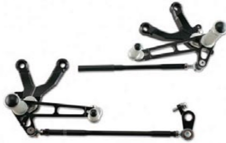
Ergal Racing Fussrastenanlage