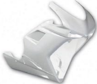
Racing Verkleidung (lackiert)