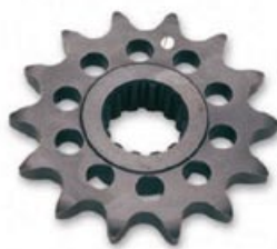
Ritzel 525 - Z14