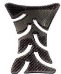
Carbon Design Tankpad