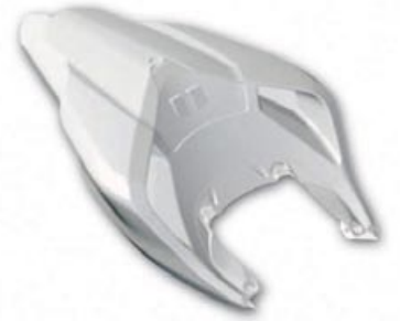
Racing Heck (lackiert)