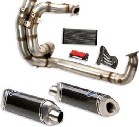
TERMIGNONI Carbon 2-in-2 Racing Auspuffanlage

D70 Krümmersatz Carbon Schalldämpfer Steuergerät Racing-Luftfilter Carbon Hitzeschutz DB-Killer